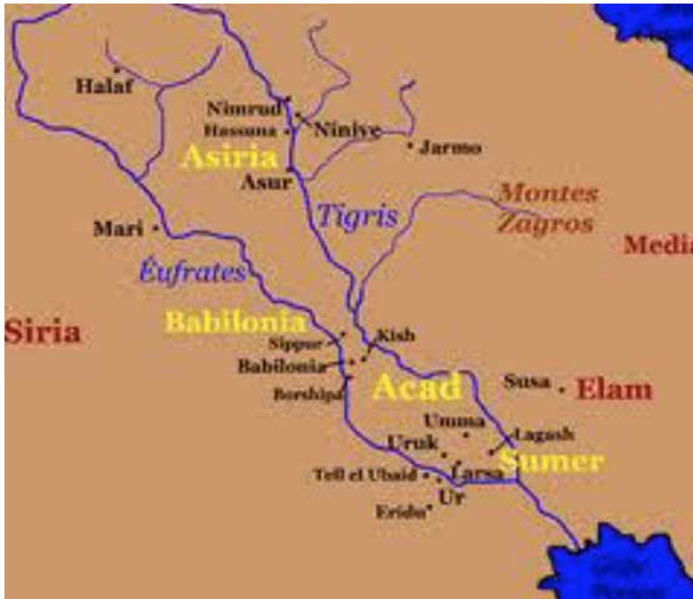
Figura 2. Mesopotamia y sus ciudades más importantes

El siguiente mapa permite ubicar espacialmente el territorio que ocupaba Mesopotamia.