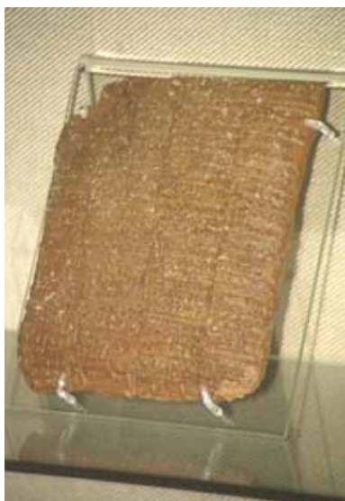
Figura 3 y 4. Tablillas de arcilla