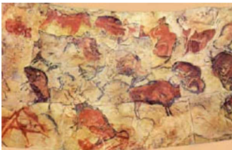
Figura 1. Pinturas rupestres de Altamira

Las pinturas rupestres de Altamira, España, son una prueba fehaciente –que ha llegado hasta nuestros días– de la necesidad de plasmar, en un soporte no perecedero, determinados acontecimientos. De ahí que “el deseo de registrar las cosas para la posteridad mediante símbolos, empleados como auxilios de la memoria, constituye un factor importante para el desarrollo de la auténtica escritura” (Gelb, 1976, p. 248). Con el pasar de los años esta técnica se perfecciona y los hechos quedan registrados en distintos soportes, desde las tablillas de arcilla hasta los respaldos digitales actuales.